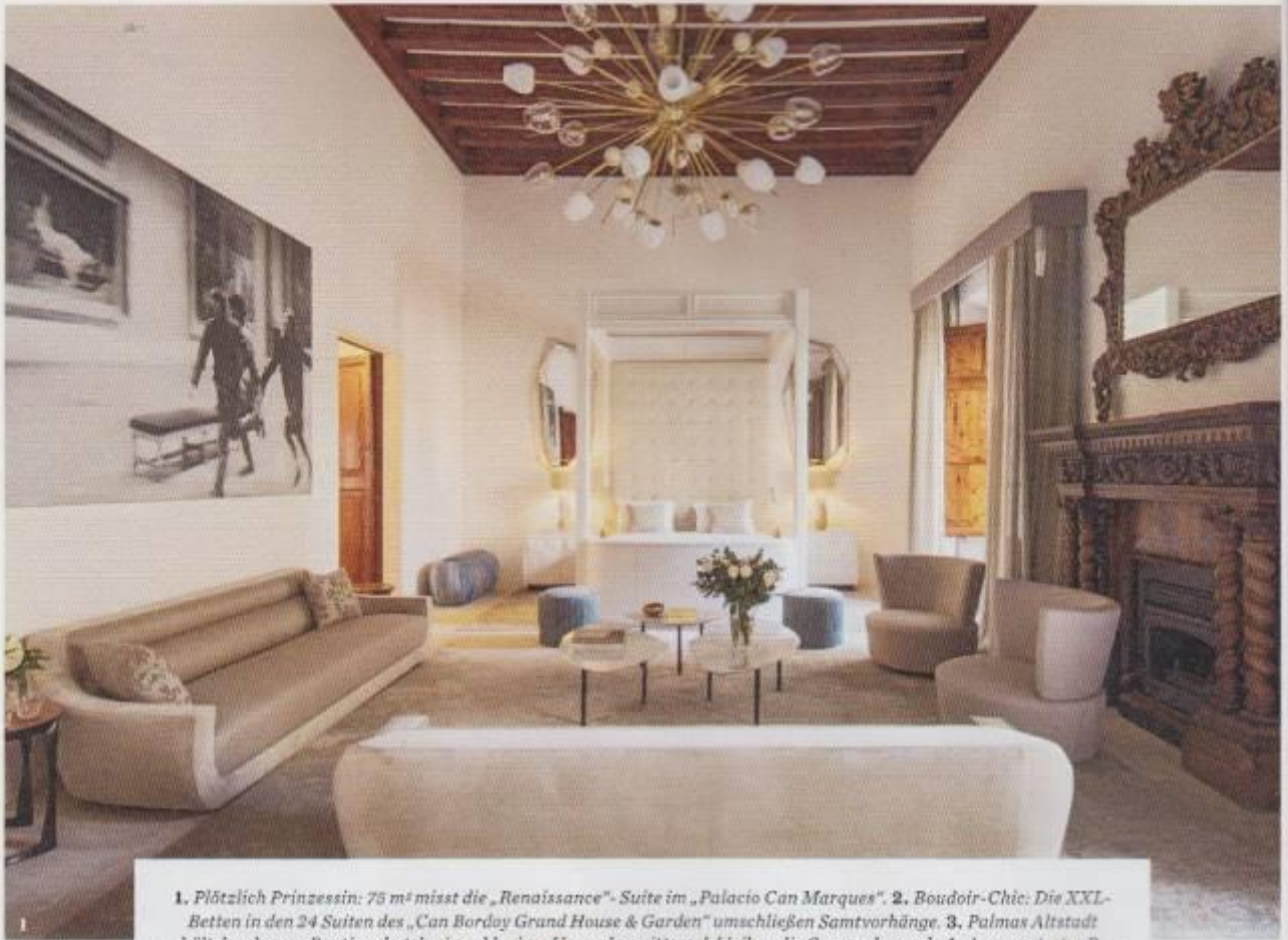
1. Plötzlich Prinzessin: 75 m 2 misst die „Renaissance“-Suite im „Palacio Can Marques“. 2. Boudoir-Chic: Die XXL-Betten in den 24 Suiten des „Can Bordoy Grand House & Garden“ umschließen Samtvorhänge. 3. Palmas Altstadt erhält durch neue Boutiquehotels ein exklusives Upgrade – pittoresk bleiben die Gassen dennoch. 4. Angesagtestes Restaurant derzeit: die Tapasbar „El Camino“. 5. Grüne Oase: Der Garten des „Can Bordoy“ ist der größte in ganz Palma